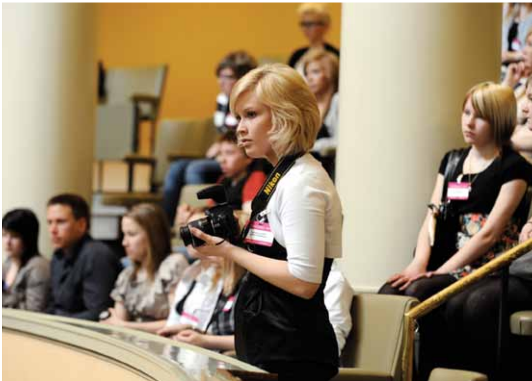
Toimittajaoppilaat työssään lehterillä / Journalisteleverna i sitt arbete på läktaren

Arvoisa puhemies! Hallituksella ei enää tässä vaiheessa ole aikomusta tehdä esitystä naisten pakollisesta kansalaispalveluksesta, mutta hallituksella on meneillään pohdintoja ja työtä sen suhteen, millä tavalla meillä asepalvelusta uudistettaisiin, millä tavalla siviilipalvelusta uudistettaisiin. Näissä pohdintoissa on tarkoitus hyvin laajasti katsoa sitä, millä tavalla näitä järjestelmiä tulisi uudistaa toisaalta Puolustusvoimien kannalta, mikä kuuluu ministeri Häkämiehelle, ja toisaalta yleisesti yhteiskunnan kannalta. Meillähän tällä hetkellä on mahdollista, että naiset osallistuvat asepalvelukseen, mutta naisille se on vapaaehtoista, kun taas miehille tuo velvollisuus on pakollinen.