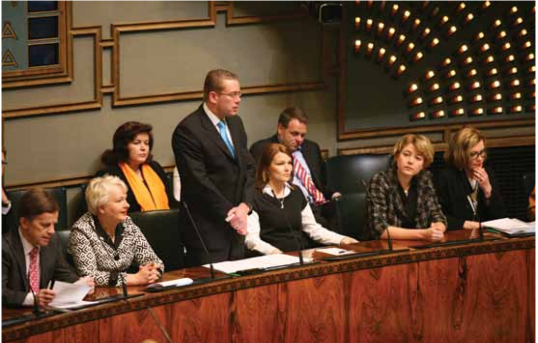
Paikalla oli 17 ministeriä, vastaamassa kulttuuri- ja urheiluministeri Stefan Wallin / Sammanlagt 17 ministrar var på plats, kultur- och idrottsminister Stefan Wallin i tur att svara

viä päätöksiä, niissä otetaan laajasti huomioon, paitsi taloudelliset näkökohdat, niin lasten ja nuorten hyvinvointi ja nimenomaan myös ilmasto- ja ympäristökysymykset, joihin kysyjä viittasi.