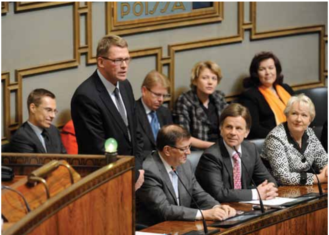
Pääministeri Matti Vanhanen vastasi ensimmäiseen kysymykseen / Statsminister Matti Vanhanen svarade på den första frågan

Arvoisa puhemies! Tähän ilmastonmuutokseen liittyen haluaisin turvata sen, että meillä suomalaisilla on jatkossakin omaa ruokaa. Kun ajatellaan, että maapallolla väestömäärä kasvaa niin, että kolmenkymmenen vuoden kuluessa maapallon ruuantuotantoa pitää pystyä lisäämään 70 prosentilla nykyisestä, niin sen eteen haluaisin tehdä töitä.