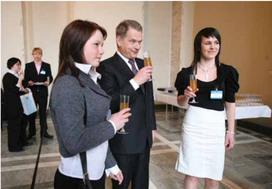
Täysistunnon jälkeen puhemies Sauli Niinistö isännöi vastaanottoa Valtiosalissa / Efter plenum var talman Sauli Niinistö värd för en mottagning i Rikssalen