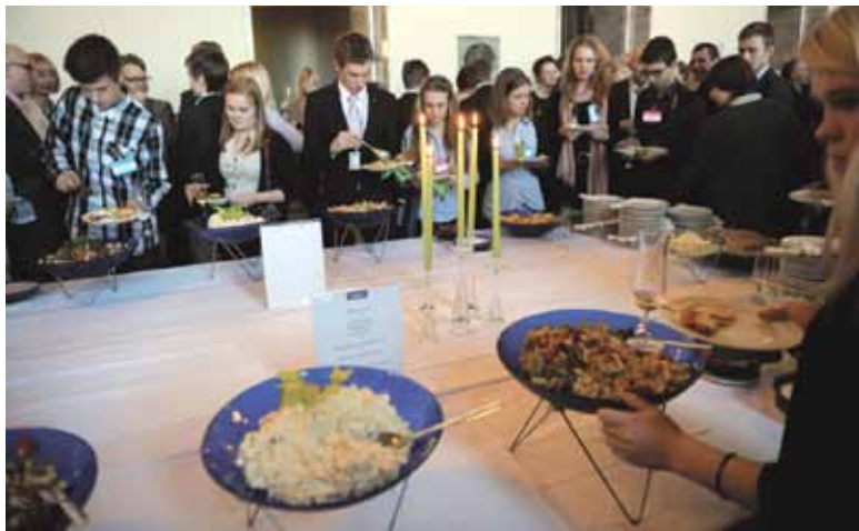
Istunnon jälkeen järjestetyllä Puhemiehen vastaanotolla nuoret saivat nauttia juhlapöydän antimista.

Nuorten esittämät kysymykset heijastavat tärkeitä yhteiskunnallisia teemoja keväällä 2012. Kysymykset liittyvät yleisesti yhteiskunnassa käytävään keskusteluun, tosin nuoret nostavat enemmän esille oppilashuoltoon liittyviä kysymyksiä. Myöskään joukkoliikenteeseen liittyvät asiat eivät ole nousseet kovinkaan voimakkaasti esille julkisuudessa. Kumpikin kysymyskokonaisuus kumpuaa nuorten elämissä maailmasta – oppilashuollon pulmat kohdistuvat koululaisiin ja joukkoliikenteen käyttäjinä nuoret koululaiset ovat varmasti hyvin edustettuina.