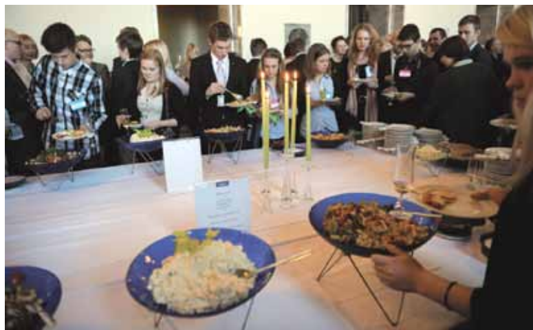
Efter plenum var det talmanens mottagningsfestbord med läckert festbord

Frågorna från eleverna avspeglar samhällseliga teman som var på tapeten våren 2012. De tangerade rent allmänt den debatt som då fördes ute i samhället, men eleverna är mer fokuserade på elevvård. I likhet med elevvården var kollektivtrafiken inte något stort tema i samhällsdebatten. – Båda temana, elevvård och kollektivtrafik, har emellertid nära koppling till ungdomarnas liv och värld. Problem inom elevvården drabbar dem själva och som skolelever anlitar de flitigt kollektivtrafiken.