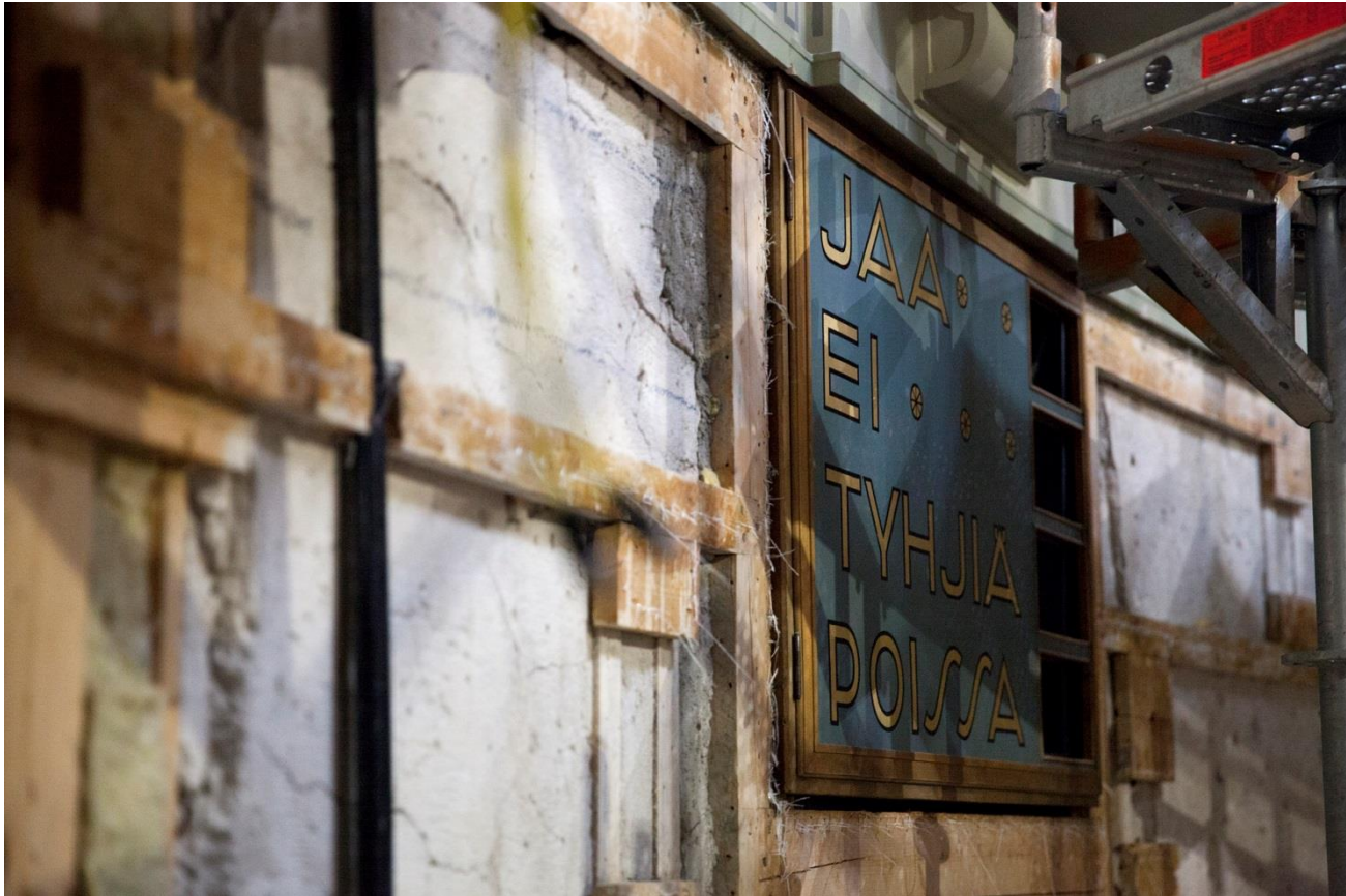
Kuva istuntosalin remontista

"Tavallisten kansalaisten poliittinen osallistuminen on demokratian sydän, jota ilman todellista demokratiaa ei ole". George Moyser, 2003