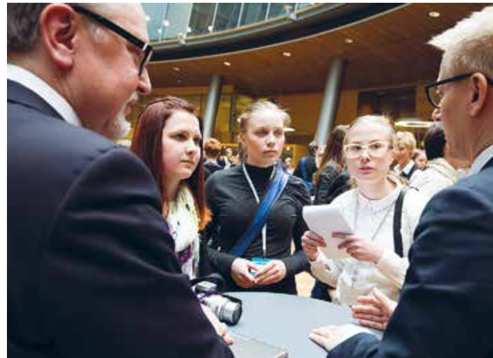
Nuorten parlamenttiin osallistuneet toimittajaoppilaat haastattelevat kansanedustaja Antero Laukkasta (kd.) (kuvassa vasemmalla) ja maatalous- ja ympäristöministeri Kimmo Tiilikaista (kesk.).

Eduskunta valmistautui Suomen itsenäisyyden 100-vuotisjuhliin. Tapahtumasarja alkoi Kansanedustaja kouluissa –teemaviikoilla. Juhlavuoden aikana eduskunta järjestää noin kuusikymmentä kotimaista ja kansainvälistä tapahtumaa. Eduskunnan juhlaistunto pidetään 5.12.2017.