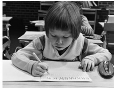
Eduskunta tekee päätöksen peruskoulusta -tietopaketti