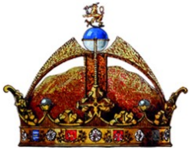
Kamppailu hallitusmuodosta 1918–1919 -tietopaketti