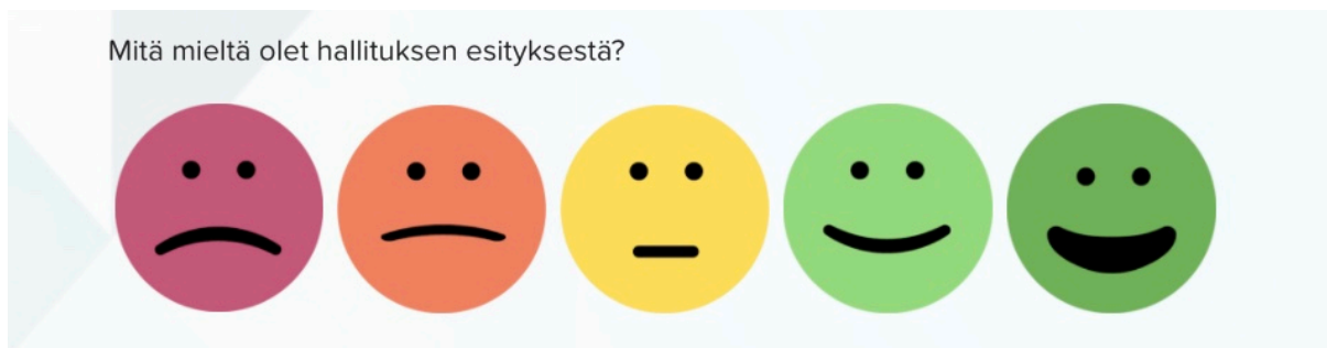
Kuva 1. Hallituksen ja Nuva ry:n esitysten arviointi hymynaamojen avulla

Vastaajia pyydettiin kyselyssä arvioimaan tarkemmin hallituksen esityksen (HE 15/2017 vp). 26 §:ää Maakunnalliset vaikuttamistoimielimet sekä Suomen Nuorisovaltuustojen Liitto ry:n laatimaa omaa esitystä maakunnallisia nuorisovaltuustoja koskevaksi lainsäädännöksi.