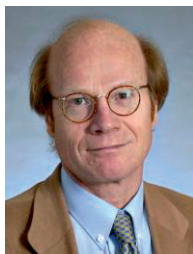
Varapuheenjohtaja Kimmo SASI (kok)