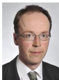
Jussi HALLA-AHO (ps)