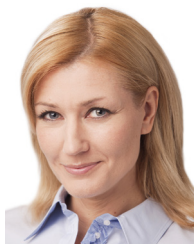
Puheenjohtaja Maria GUZENINA (sd)