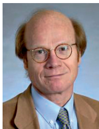
Varapuheenjohtaja Kimmo SASI (kok)