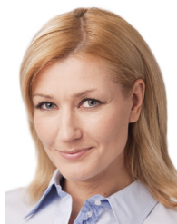
Puheenjohtaja Maria GUZENINA (sd)