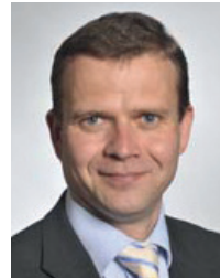
Petteri ORPO (kok)