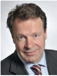
Puheenjohtaja Ilkka KANERVA (kok)