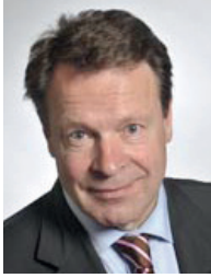
Ordförande Ilkka KANERVA (saml)