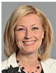
Ordförande Maria GUZENINA (sd)