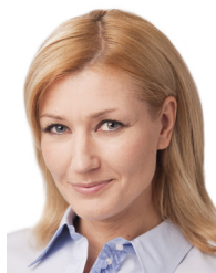
Ordförande Maria GUZENINA (sd)