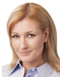
Ordförande Maria GUZENINA (sd)