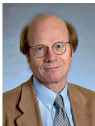
Vice ordförande Kimmo SASI (saml)