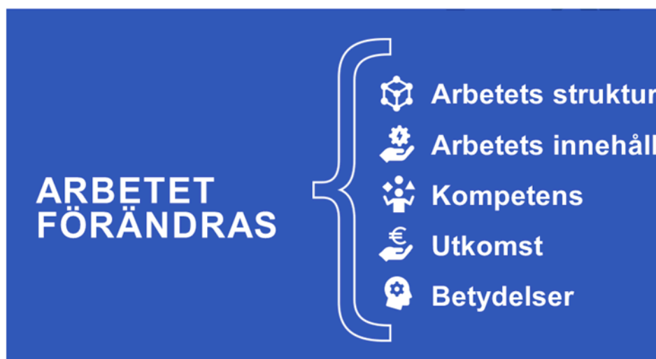
Bild 1. Arbetets förändringar

I detta kapitel lyfter vi upp fem teman och frågor i anslutning till förändringsgången för arbetet som det vore viktigt att finna svar och lösningar på i den nära framtiden.