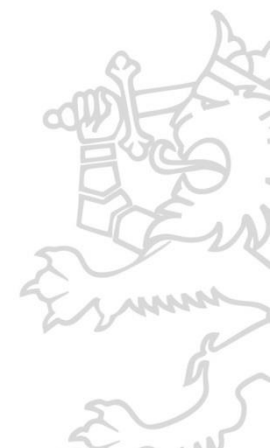
Budjettitalouden tulot, menot ja tasapaino